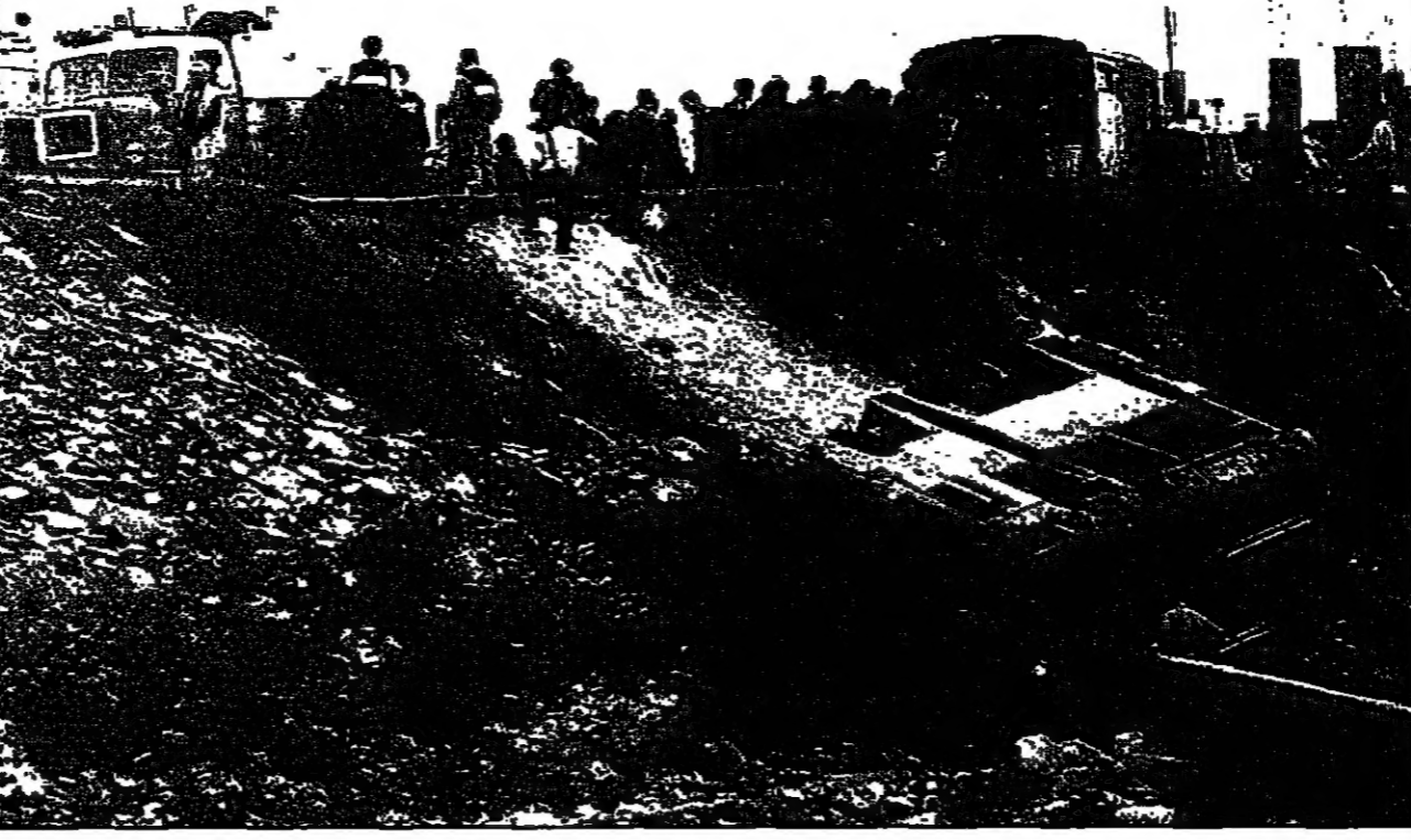
قوات شرطة إسرائيلية تسيطر بالمنطقة التي خلفها بيت الحانقة